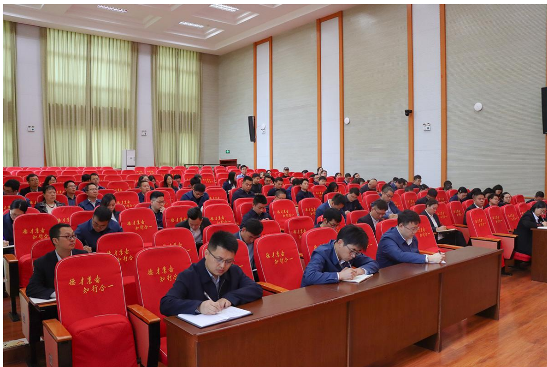
学校全体中层干部、顶岗锻炼人员参加会议。