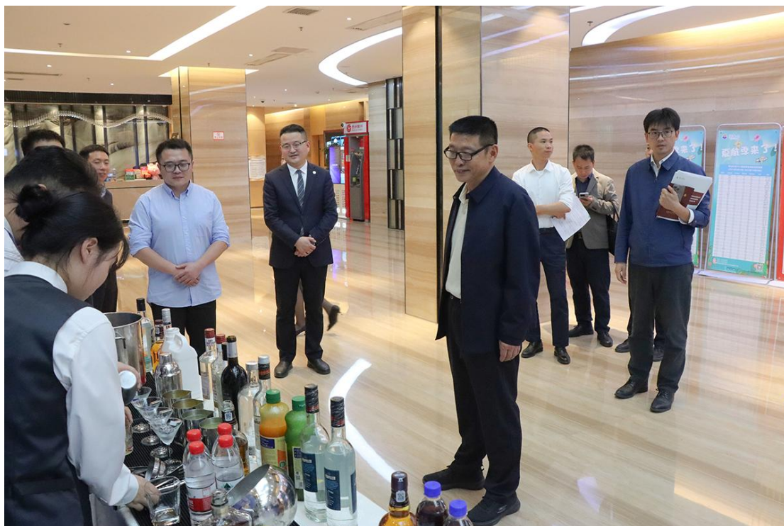
各实践教学基地、学校各教学单位相关负责人参加调研。